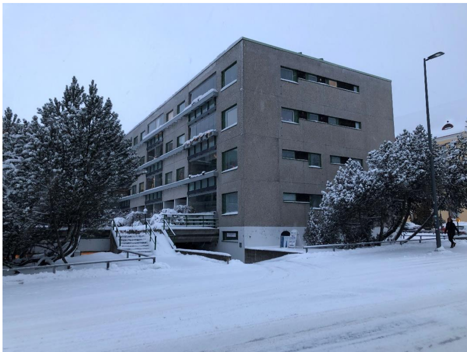
Kuva 1. Kulku pihaan ja autohalliin Erkkilänkadulta. Taloyhtiön esteetön kulku kaikkiin porraskäytäviin on tarkoitus rakentaa Erkkilänkadun puolelta autohalliluiskan ja pihaan johtavien portaiden viereen.

Talon neljästä porraskäytävästä on kadulle (Siukolnkatu ja Huhtimäenkatu) korkeat portaat, porraskäytävistä pihatasanteelle on muutama porraskäytävä ja matalin korkeusero kadulta pihatasanteelle on Erkkilänkadun puolelta. Kaikkien porraskäytävien asukkaille esteetön kulku on mahdollista rakentaa vain pihatasanteen kautta Erkkilänkadulta autohalliluiskan vierestä. Tämä tarkoittaa, että samassa risteyskohdassa on myös rollaattorilla/pyörätuolilla liikkuvia asukkaita. Tälläkin hetkellä yli 80-vuotiaita asukkaita tai vajaakuntoisia on n. 35 % taloyhtiömme asukkaista.