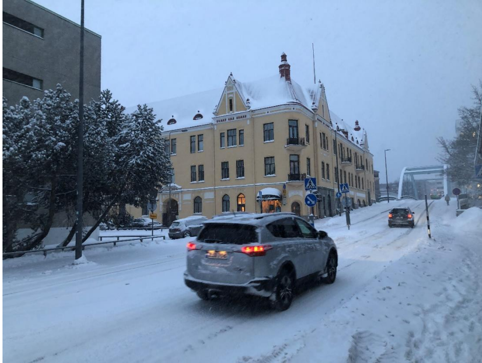
Kuva 3. Ajo Erkkilänkadulta taloyhtiön pihaan