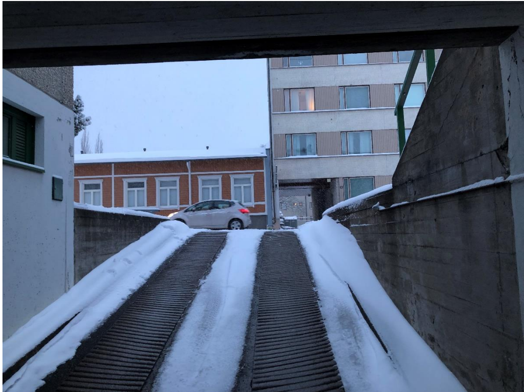
Kuva 2. Näkymä jalkakäytävälle autohallista ulosajettaessa. HUOM! Kuva otettu seis- ten, autoilija istuu autossa matalammalla tasolla.